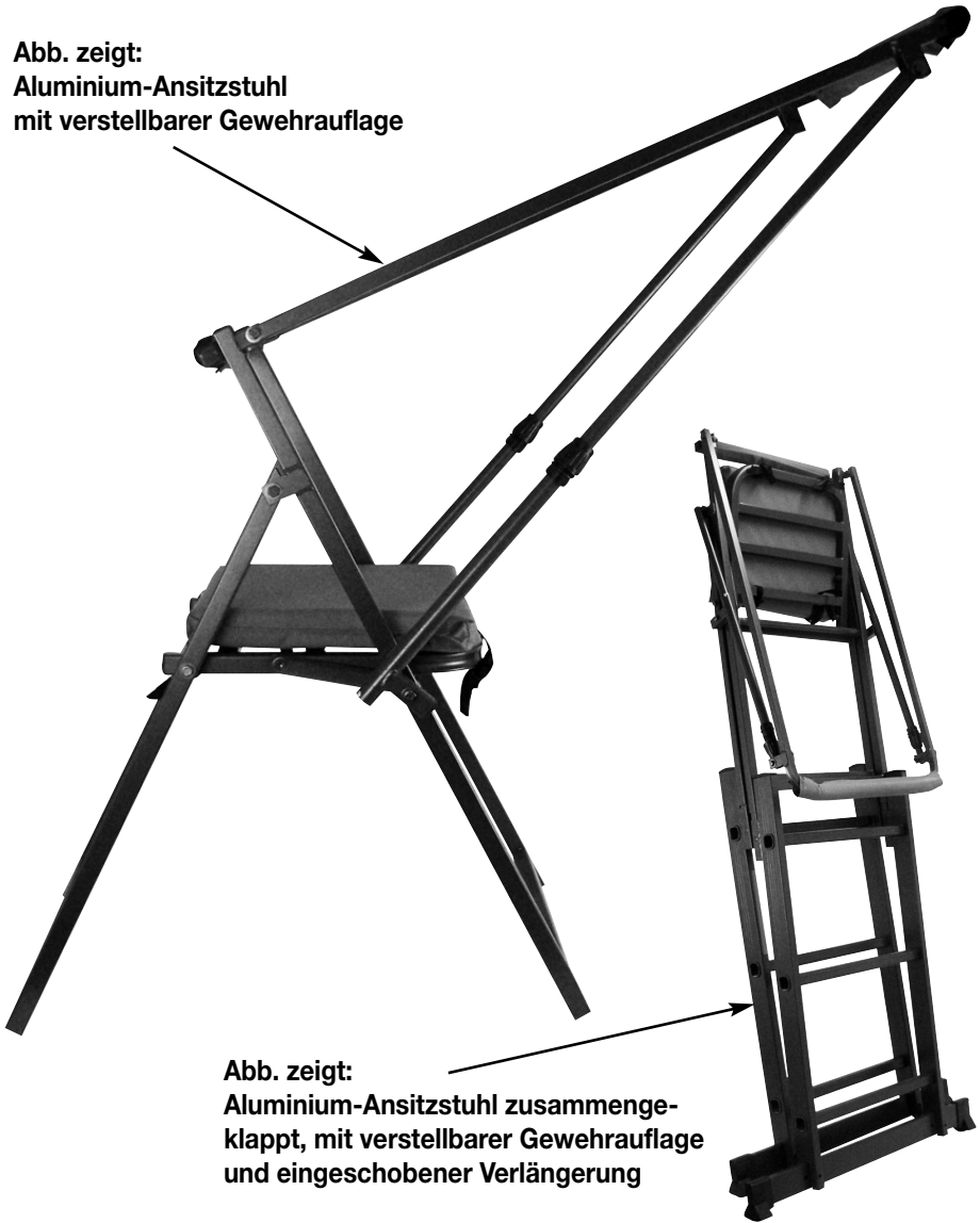
Abb. zeigt: Aluminium-Ansitzstuhl zusammengeklappt, mit verstellbarer Gewehrauflage und eingeschobener Verlängerung

Abb. zeigt: Aluminium-Ansitzstuhl mit verstellbarer Gewehrauflage