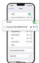
Select with "Stong-..." and connect (WIFI password : 12345678)