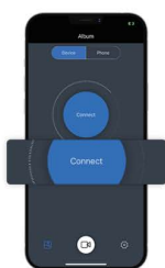
Turn on APP APPshowx