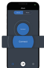
Öffnen Sie die App -> APPshowx