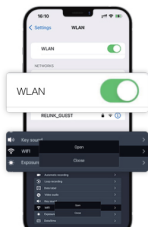
Schalten Sie ihr WiFi auf ihrem Gerät ein