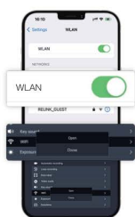
Turn on WIFI on your phone and device