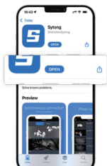
Laden Sie die App herunter