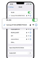
Verbinden Sie mit „Sytong-...“ (WiFi Passwort: 12345678)