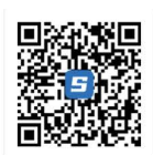
Android/iOS Scan and Download